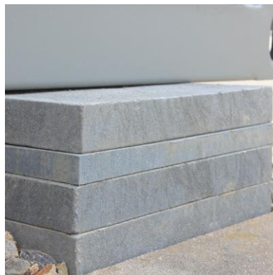
Fundamentalschema für Raumcontainer 20'